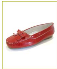
8012 AS Vermelho