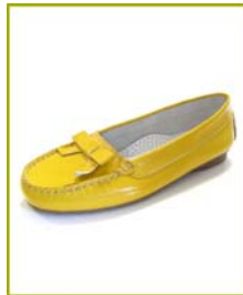
8012 AS Amarelo